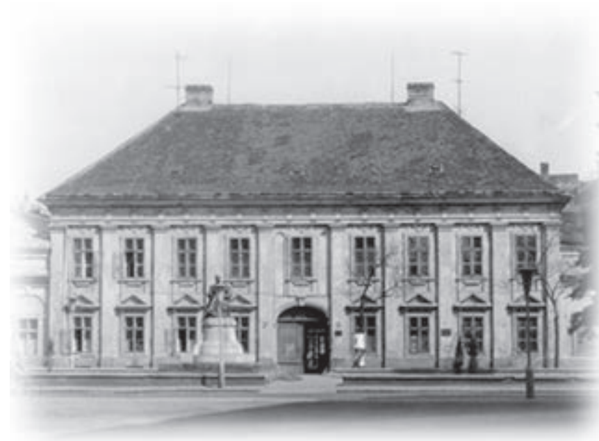
A régi zeneiskola épülete