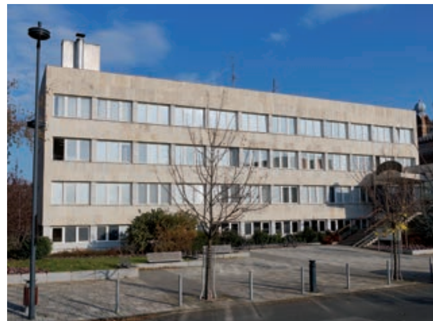
Szombathelyi Bartók Béla Zeneiskola - AMI